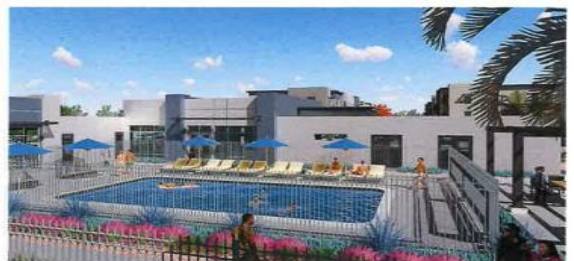
VIEW ON CLUBHOUSE POOL AREA 5