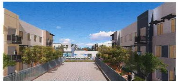
VIEW ON 44TH AVENUE LOOKING NORTHWEST 3