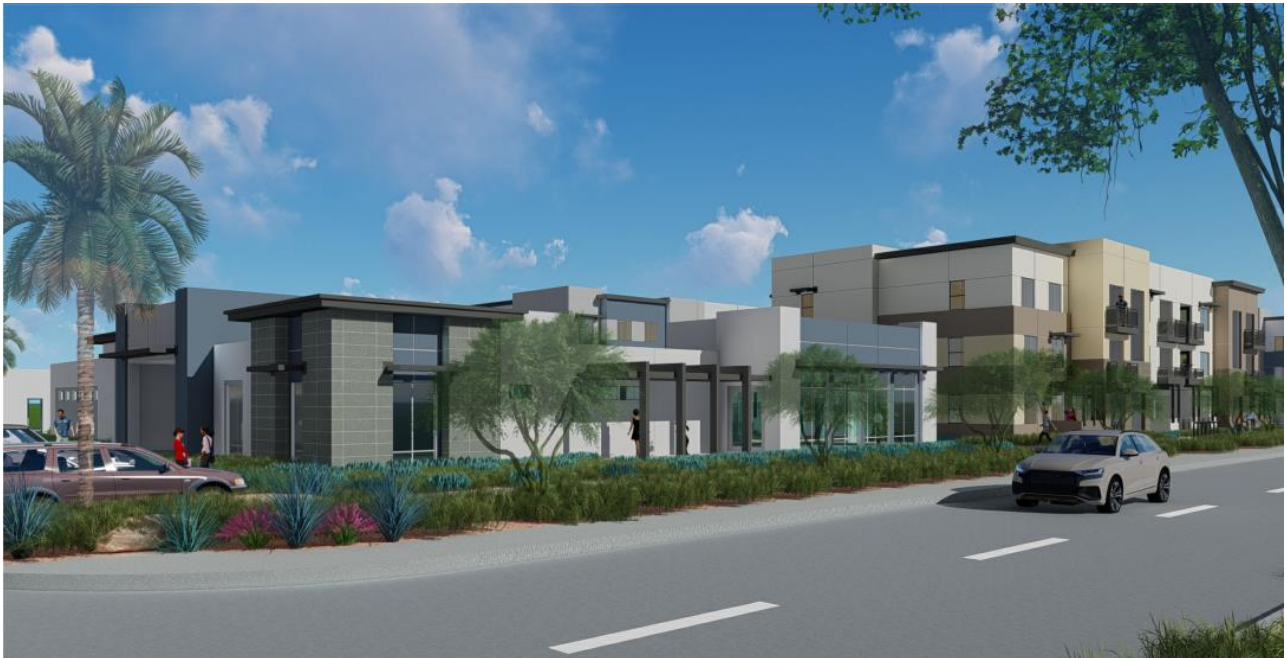
Vista desde la avenida 44th mirando al noreste