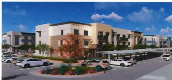
VIEW ON INTERIOR REAR STREET (BLDG.3A) 4