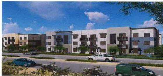
VIEW ON 44TH AVENUE LOOKING NORTHWEST 2